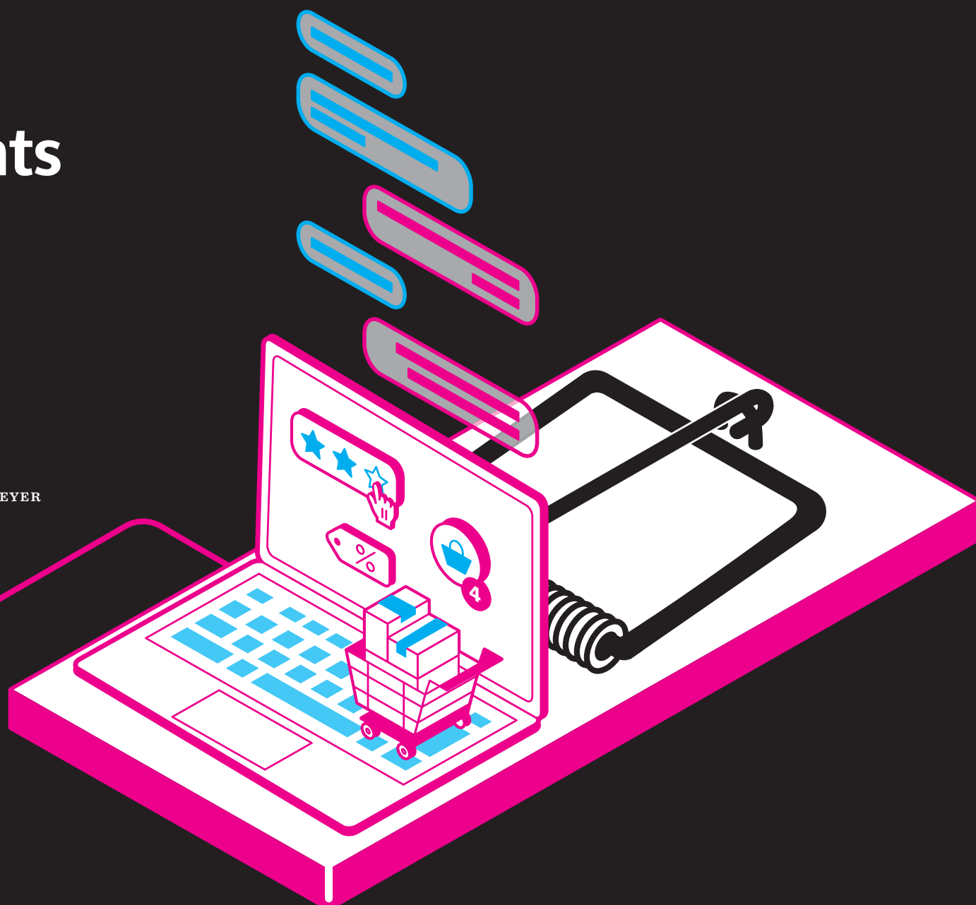
ILLUSTRATION: CAROLINE VOGT

VON HANNES MUNZINGER, LEA WEINMANN UND NILS WISCHMEYER